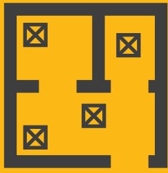
TABLEAU DE BORD PRIORITAIRE POUR LES MESURES D'URGENCE

Le tableau de bord du bâtiment permet aux équipes d'urgence de naviguer rapidement à l'intérieur d'un bâtiment. Cet outil peut également être relié à toute autre plateforme géomatique.